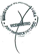
Milton von Hesse La Serna MINISTRO DE AGRICULTURA