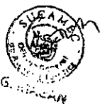
DERIK ROBERTO LATORRE BOZA Superintendente Nacional Superintendencia Nacional de Control de Servicios de Seguridad Armas, Municiones y Explosivos de Uso Civil - SUCAMEC