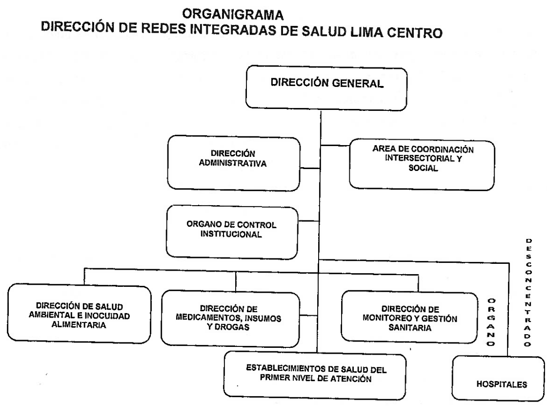
Gráfico 1. Estructura de la DIRIS Lima Centro.

Para el cumplimiento de sus funciones, la DIRIS Lima Centro cuenta la siguiente estructura orgánica (Gráfico 1):