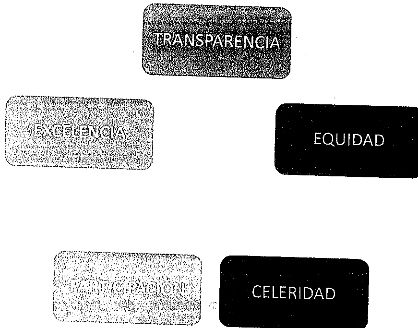
Grafico N° 1: Principios a ser considerados en la elaboración del Plan de Desarrollo de las Personas