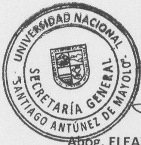
[Signature] Abog. ELEAZAR MANUEL ESPINOZA VALVERDE SECRETARIO GENERAL

ARTÍCULO 2°.- DISPONER, que los órganos competentes de la UNASAM den cumplimiento la presente Resolución.