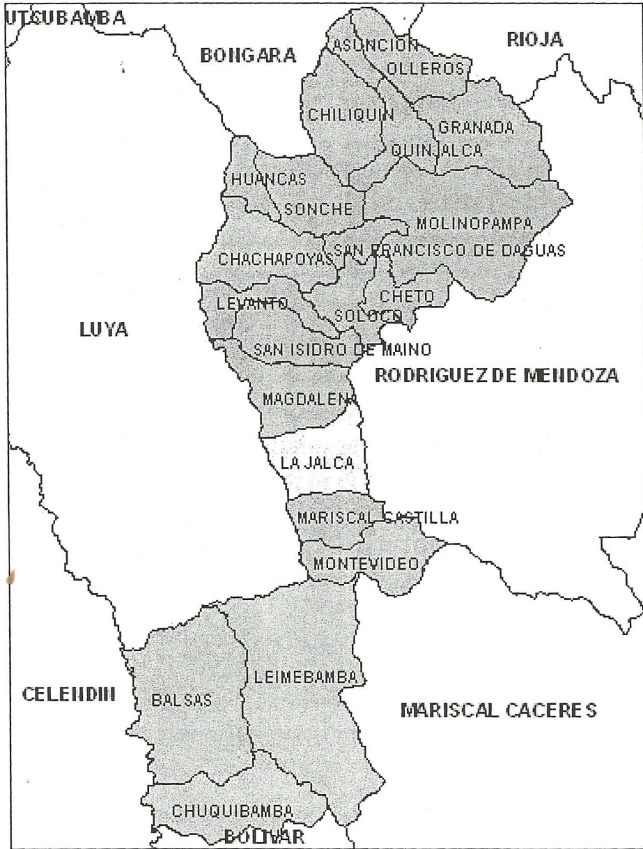
MAPA DE CHACHAPOYAS